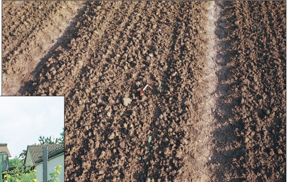
Stabile Krümelstruktur - geringe Verschlammungsneigung trotz starkem Regen.