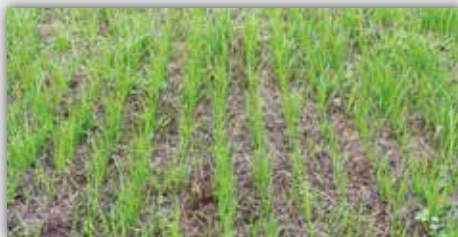
Während Vredo (Tag 13)