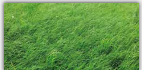
Nach Vredo (Tag 31)