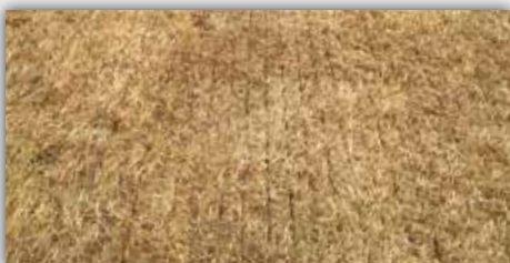
Vor Vredo (Tag 1)

Wenn Qualität, Leistung und Ergebnis für Sie und Ihre Kunden von großer Bedeutung sind, ist die Vredo Agri Air-Serie die professionellste Maschine ihrer Art.