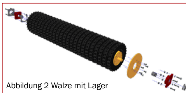
Abbildung 2 Walze mit Lager