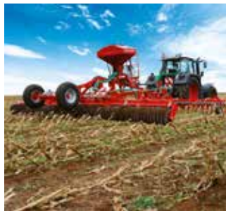
Bekämpfung - Maiszünsler nach Silomais