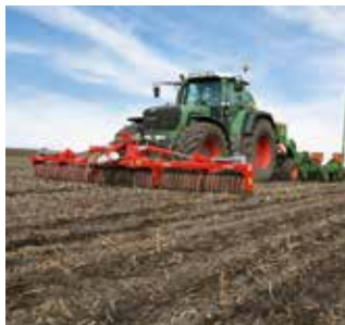
Güttler-Walze in Front zur Maissaat