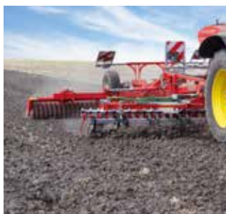
Bestellung von Zwischenfrüchten