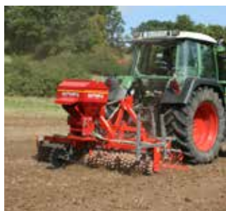
Umbruchlose Neuansaat von Grünland